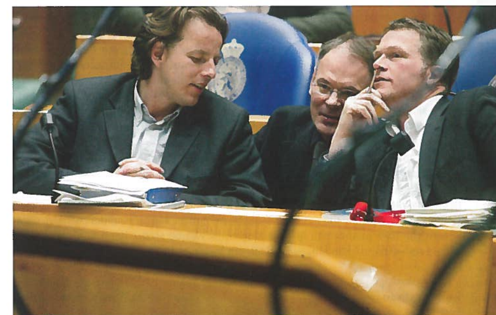
Als Kamerlid, achter Bert Koenders (links) en Wouter Bos (rechts), 2003

Mijn keuze om kok te worden bracht mij in 1964 naar de RK. LTS 'St. Joseph-school' in het Spuikwartier. Dagelijks wandelde ik vanuit de Bakhuisenstraat door de Hobbemastraat, de Hoofstkade en het Groenewegje naar het Spui en het Lamgroen daarachter. Het was een tijd waarin de gemeenteraad, op afspraak van de plannemakers, 'ons' deel van Den Haag had afgeschreven. Het hart van 's-Gravenhage zou met het centrumplan 'de Nieuwe Hout' nieuw elan krijgen. De Schilderswijk zou 'van Grijs naar Groen' verkleuren, en het 'Verkeerscirculatieplan Binnenstad' zou dit alles voor de auto bereikbaar maken. Slechts het Spuikwartier, de Rivierenbuurt, het oude Centrum, de Stationsbuurt, de Schilderswijk en Kortenbos zouden hiervoor grotendeels moeten worden geamoveerd, in die tijd een eufemisme voor slopen. Wat, ondanks het achterstallige onderhoud, zo vanzelfsprekend