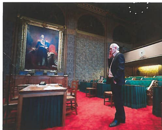
Als senator tussen de groene bankjes in de Eerste Kamer.

Soms is er iemand die in alle eenvoud onder woorden kan brengen wat er eigen-