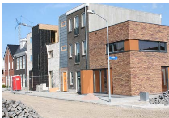
Boelijn, Noorderplassen West