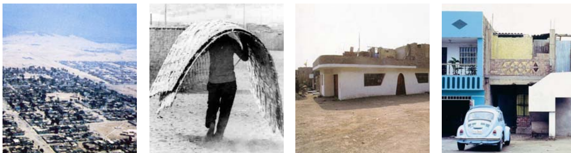
Villa El Salvador, Lima

Het meest nadrukkelijk openbaarde dit zich in Villa El Salvador, een grote voorstad van Lima, waar zo'n 400.000 mensen wonen. Mede door gebrek aan financiële middelen heeft de overheid zich daar beperkt tot het uitzetten van een eenvoudige stedenbouwkundige structuur, het aanbieden van openbaar vervoer en de uitgifte van kavels, met elk een aansluiting op water, elektriciteit en riolering. De bewoners kopen een kavel, zetten daar in eerste instantie een rieten huisje op, en bouwen er in de loop der tijd een woning omheen. Iedere keer dat geld beschikbaar komt, kopen zij bouwmaterialen en wordt gestart met een volgende etage. Soms wordt woonruimte omgezet in werkruimte, soms andersom. De woningen worden gedecoreerd, en er komen tuintjes in wat voorheen woestijn was. Het is een schrijnende constatering, maar feit is dat de kwaliteit van Villa El Salvador hoger is dan veel van onze VINEX-locaties. Met verbazing heb ik gezien hoe arme mensen - in een arme stad in een arm land - grotere woningen bouwen dan wij in Nederlandse VINEX-wijken doen, en een enorme diversiteit weten te creëren. Als het bezoek aan Villa El Salvador mij iets heeft geleerd, is het dat wij onze ruimtelijke ordening niet minutieus van bovenaf moeten plannen. Stedenbouw moet dienstbaar zijn aan de zelfkracht van burgers; zij maken de stad.