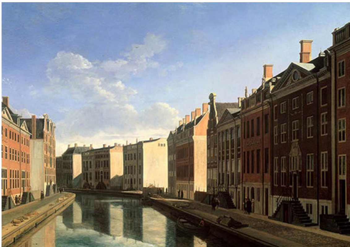
'Gouden Bocht', Gerrit Berckheijde, 1671/1672

Tegelijkertijd is dit essay een uitnodiging. Een open uitnodiging, gericht aan eenieder die onderdeel wil zijn van onze zoektocht. De uitnodiging is niet voorbehouden aan zelfbouwers - juist niet. Met de ontwikkeling van het Europakwartier komt een einde aan het onderscheid tussen particuliere en institutionele opdrachtgevers. Deze uitnodiging is nadrukkelijk ook voor corporaties, voor ontwikkelaars, voor aannemers, voor architecten. Feitelijk richten wij ons op ieder initiatief dat direct aansluit op een concrete vraag; of dat nu één woning, tien woningen, dertig woningen, een maatschappelijke voorziening, horeca, bedrijf of winkel betreft. 'Hoe adaptief moet stedenbouw zijn, om langs de lijn van een veelvoud van kleinschalige initiatieven te komen tot een organische ontwikkeling van het Europakwartier?' Dat is de kern, het is de uitdaging deze vraag te beantwoorden. Iedereen die bereid is deze uitdaging aan te gaan, ontvangen wij graag in onze Bouwfabriek Almere Poort.