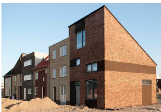
Ikbouwbetaalbaar in Almere, Homeruskwartier

Met een dergelijke Bouwfabriek wordt een directe relatie met de opdrachtgevers aangegaan. Waar plannen voorheen in het Stadhuis werden gemaakt, gebeurt dat in het vervolg op locatie. Dit betekent dat er een fundamentele omslag plaatsvindt, die verder strekt dan een verandering van fysieke werkplek. Het gaat om een onderlinge verbondenheid tussen gemeente en opdrachtgever, om gelijkwaardigheid en om het accepteren van veranderende rollen: de ambtenaar faciliteert, wordt meer en meer service- en dienstverlenend, om aan de vraag van initiatiefnemers te kunnen voldoen.