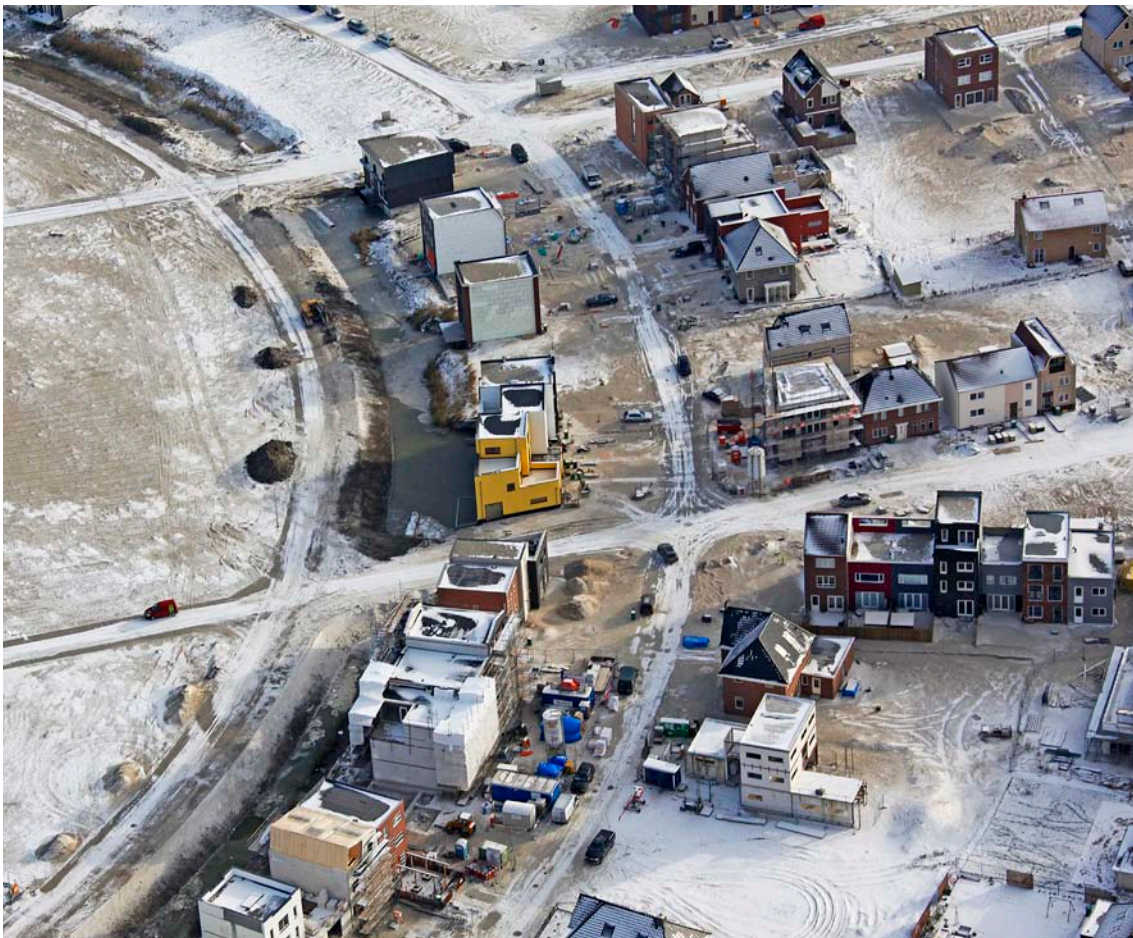
Homeruskwartier, Almere Poort

Niettegenstaande het feit dat deze publicatie - juist omdat het vrijwel volledig aansluit op onze ideeën - uiterst bruikbaar is in het proces dat wij nu starten, blijft het hier bij "endless passionate discussions" . Het Europakwartier biedt ons de kans 'het papier' te ontstijgen. Hoewel het huidige stedenbouwkundig plan is ingericht op één of twee ontwikkelende partijen, is het goed mogelijk om voor de ontwikkeling van het Europakwartier een veelvoud van initiatiefnemers aan te trekken. Het Europakwartier fungeert daarmee - bijna als vanzelfsprekend - als casus om onze werkwijze met betrekking tot initiatieven van onderop om te zetten in structureel beleid. Daarmee wordt 'werk met werk' gemaakt: de ontwikkeling van een belangrijk gebied wordt gecombineerd met de verankering van (onze ervaringen met) een andere vorm van stedenbouw.