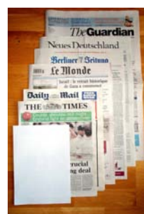
Krant als illustratie: samenhang geborgd