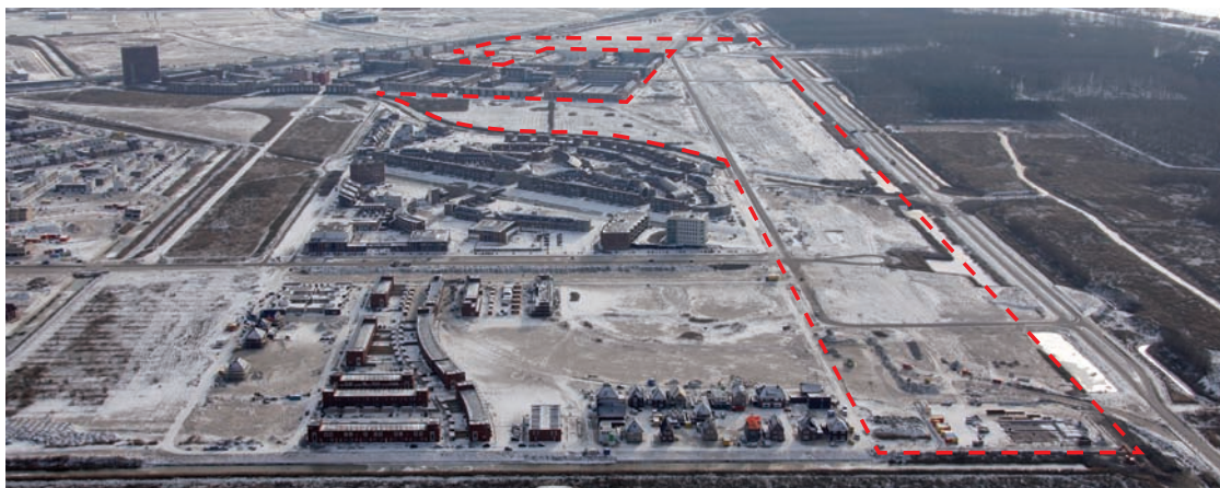
Europakwartier, Almere Poort

Deze vraag wil ik beantwoorden aan de hand van een concrete testcase: de ontwikkeling van het Europakwartier in het nieuwe stadsdeel Almere Poort. Het gaat om een langgerekt gebied (1.400 x 100 meter, 11 hectare) op de overgang naar de Kustzone. De Poortdreef, de primaire toegangsweg naar de Kustzone en het water, vormt de ruggengraat van dit gebied. In dit Europakwartier zouden institutionele partijen grote projecten realiseren, maar als gevolg van de crisis zijn veel van de plannen afgesteld. Wij kunnen wachten tot de crisis voorbij is, tot de investeringskracht van institutionele partijen is hersteld. Gezien de matige kwaliteit die een aantal institutionele partijen op onderdelen levert, met name waar het gaat om grondgebonden koopwoningen, denk ik dat dit onwenselijk is. De kunstmatig gegenereerde diversiteit representeert soms een schrijnende armoede. Ik zie de crisis dan ook als kans; een mooie kans om een andere werkwijze te introduceren.